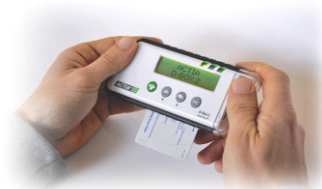
ACTIA D-Box 1 und 2